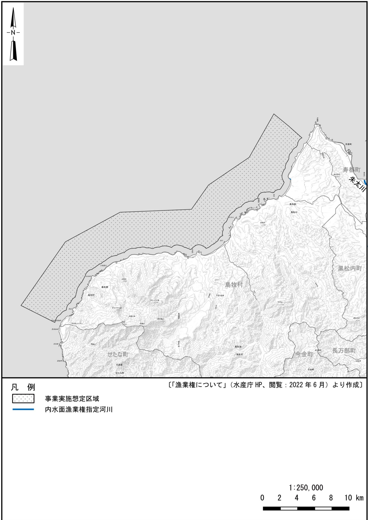
図 3.2-6 内水面漁業権の設定状況