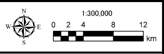
図 3.1.59 油・ガス田、パイプライン、海底ケーブル位置概略